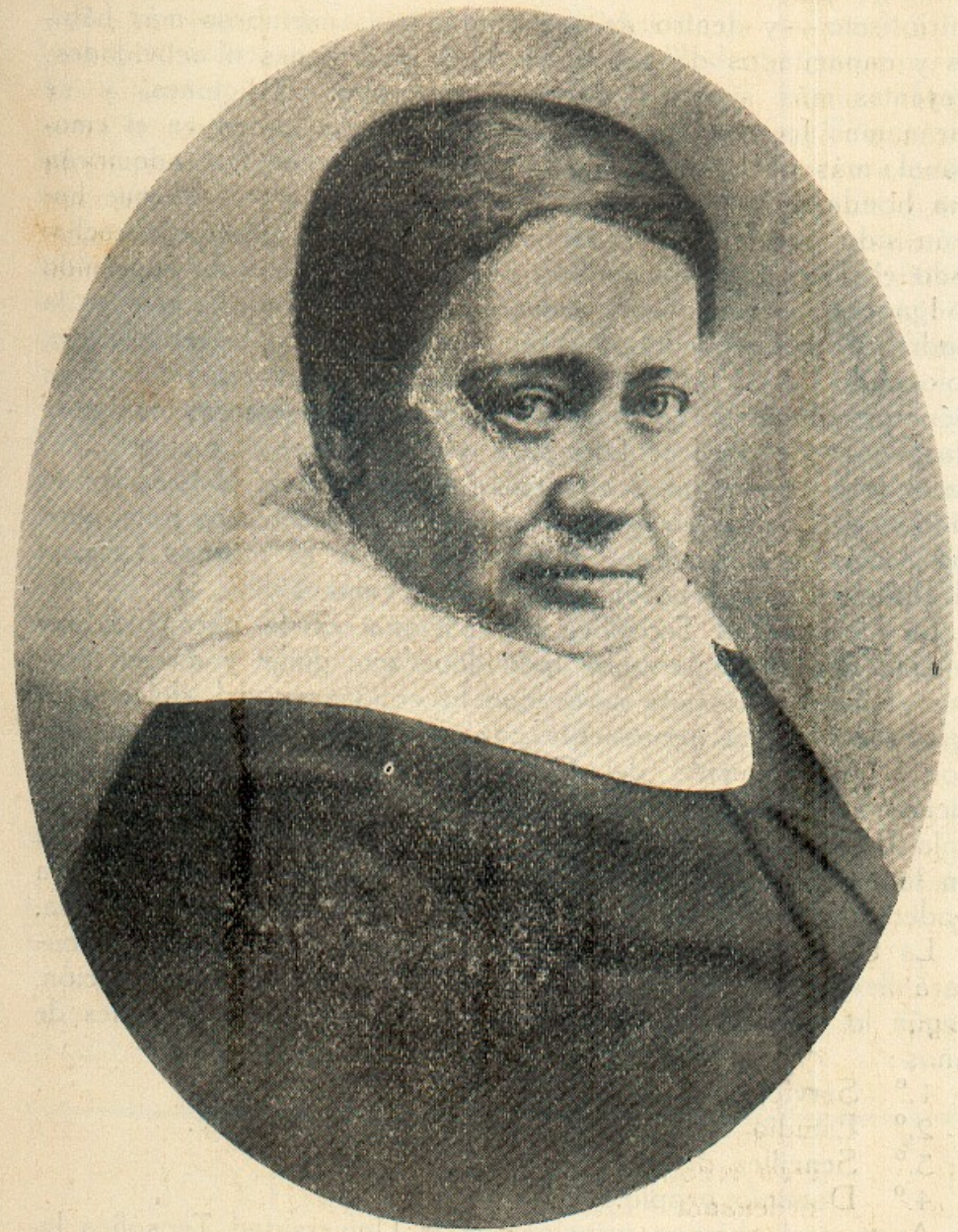
H. P. B., que dedicó su vida al desinteresado servicio de difundir las verdades de la filosofía oculta

Por lo tanto, la Universidad Teosófica Internacional preconiza el Servicio, y como consecuencia, el Estudio que tenga como finalidad la aptitud para realizar un Servicio cada vez más sabio y más amante. Sus estudiantes aprenderán que sólo sirviendo a los demás pueden realmente descubrirse, expresarse y realizarse a sí mismos, y que sus estudios, ejercicios y actividades, bien sean físicas, emocionales, mentales o espirituales, están encaminados a ayudarlos a recorrer con rapidez el Sendero del Servicio que los conducirá a los Piés de los Grandes Servidores del mundo, y por medio de Estos, a una completa expresión de su Herencia Divina. Así pues, todo estudio y todo ejercicio serán reconocidos como parte de esa Sabiduría Divina, que ordenando suave y poderosamente todas las cosas, hace que la Divinidad se manifieste en todos. Todos los temas y asuntos pertenecientes a los cursos de estudios corrientes en otras instituciones, serán estudiados, ordenados y aplicados con este espíritu en las escuelas, colegios y demás instituciones de la Universidad Teosófica Internacional, de lo cual resultará —según lo ha probado la ya larga experiencia de los jefes de la Universidad en el campo educativo— que sus estudian-