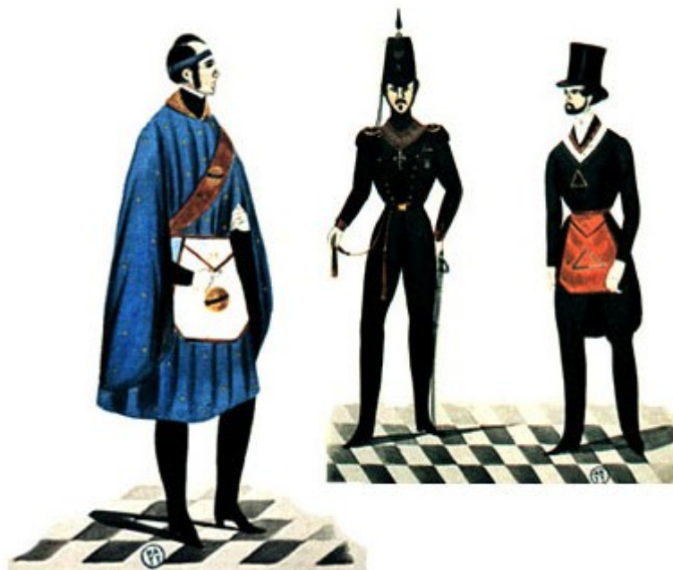
Grados 24, 25, 26