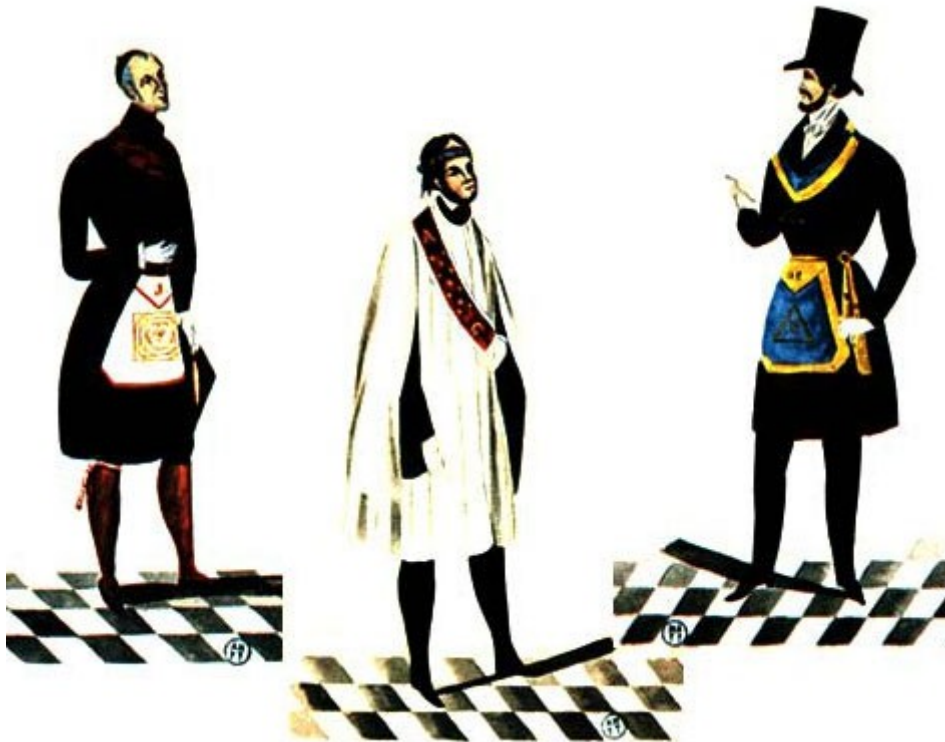
Grados 18, 19, 20