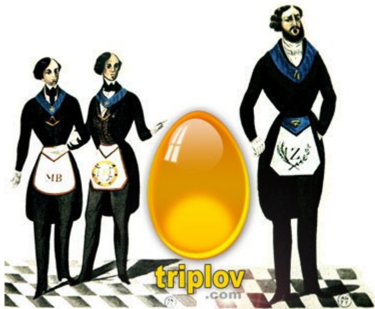
Grados 3 y 4

OBS.: O objetivo foi dar uma visão geral de cada um dos graus. Evidentemente os mesmos tem muito mais conteúdo do que foi comentado. Bons livros de Maçonaria, dedicados ao público em geral, podem - com certeza - subsidiar de forma mais apropriada àquele que pretenda saber mais. Há livros que comentam quase tudo da Maçonaria da Pedra e da Madeira. Os verdadeiros segredos, contudo, permanecem exclusivos: palavras de passe, os toques e os diversos sinais.