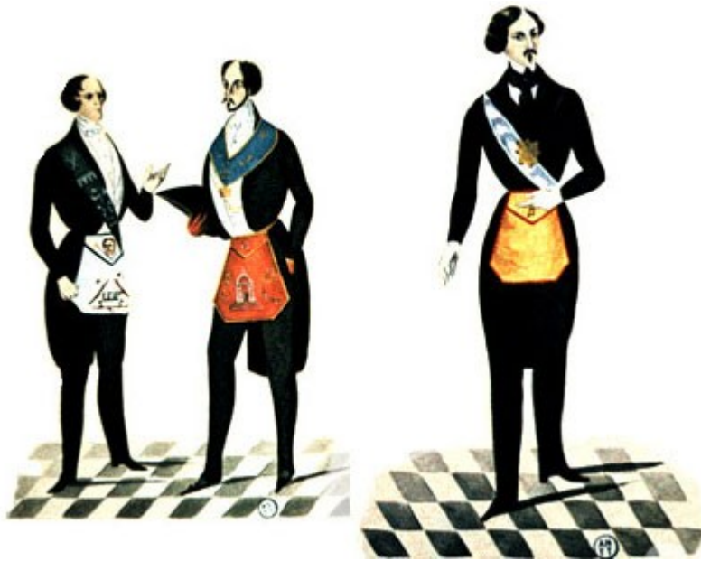
Grados 15, 16, 17