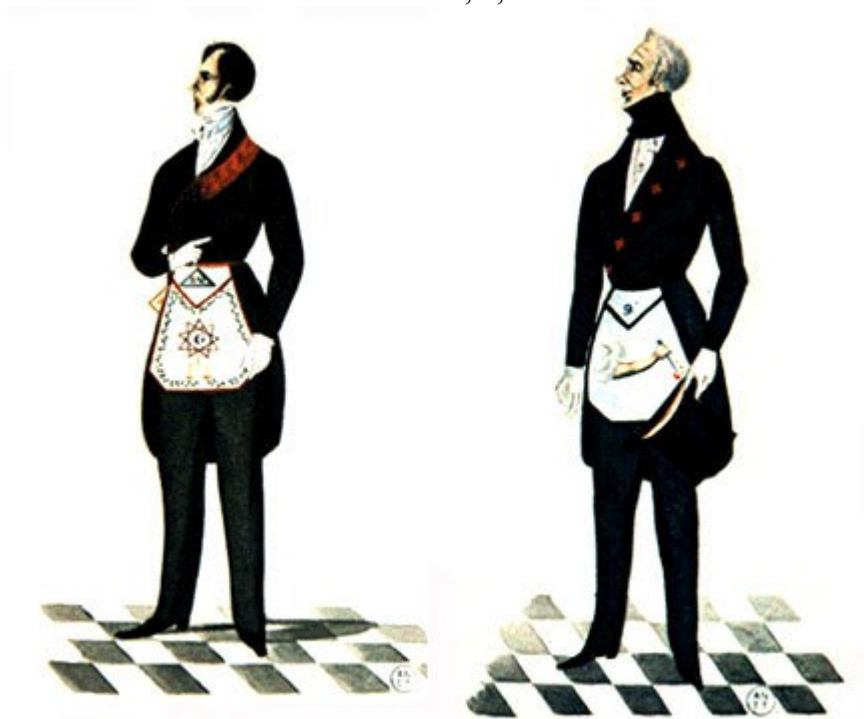
Grados 8 y 9