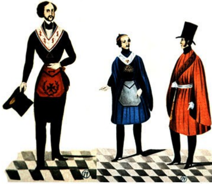
Grados 27, 28, 29