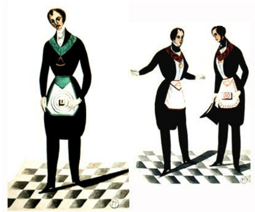
Grados 5, 6, 7.